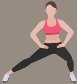
Jumping jacks 1 minuto

Energética–Quemagrasa–firmeza femenina (18 min)