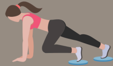
Mountain climbers 45 segundos