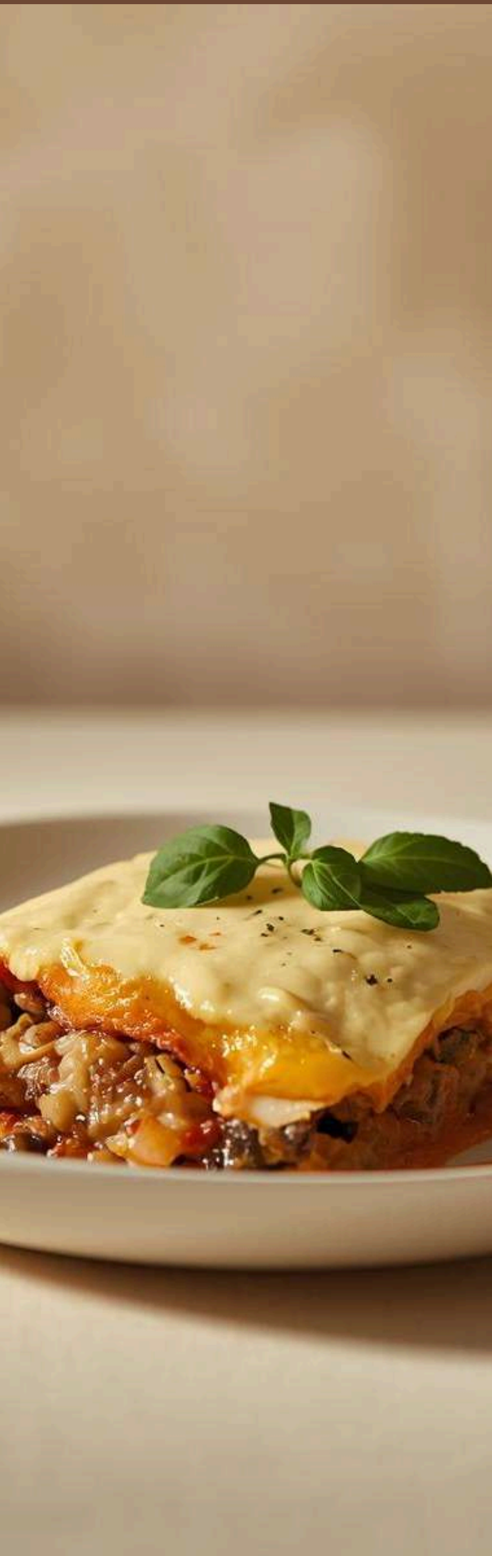
TABLA NUTRIMENTAL (POR PORCIÓN)